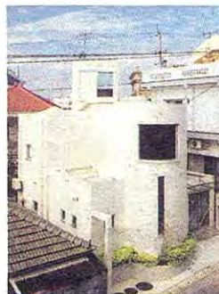
◀東(勝手口)側外観。玄関側とは異なる表情