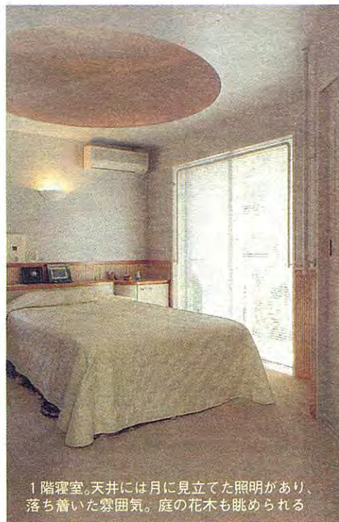
1階寝室。天井には月に見立てた照明があり、落ち着いた雰囲気。庭の花木も眺められる