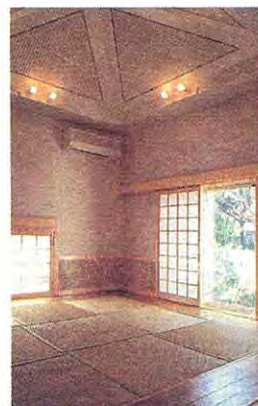
▲2階和室。ほかとは趣が異なる空間。▶3階展望書斎室。朝日の眺めは格別