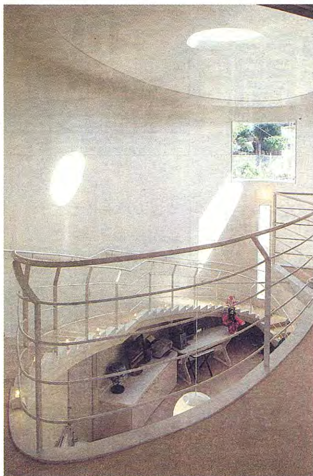
▲2階玄関ホールからLDKを見下ろす。だ円形の建物に沿って、なだらかな階段が続く。蹴上げは、約10cm。上れる高さを慎重に吟味して決定。壁には、トップライトから差し込む光が時間の経過とともに移動する様子が分かる

設計：福村俊治十空間計画VOYAGER/福村俊治・比嘉裕隆 施工：株式会社名義隈元・友利優也 電気：株式会社前田盛洋 水道：不二宮工業株式会社/仲村尚徳 サイン：HILLOデザイン研究所/小畑広永 躯体構造：鉄筋コンクリート造 敷地面積：251.28㎡(約76.1坪) 1階床面積：75.39㎡(約22.8坪) 2階床面積：45.74㎡(約13.8坪) 3階床面積：9.61㎡(約2.9坪) 家族構成：本人