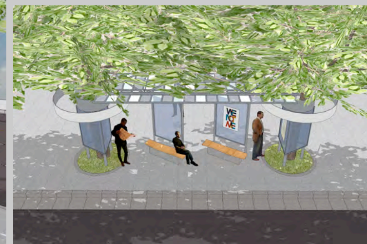
庇の上部に設置したスチールの植栽棚に枝を這わせ、将来的には緑で全てを覆い隠し木漏れ日を落とす。