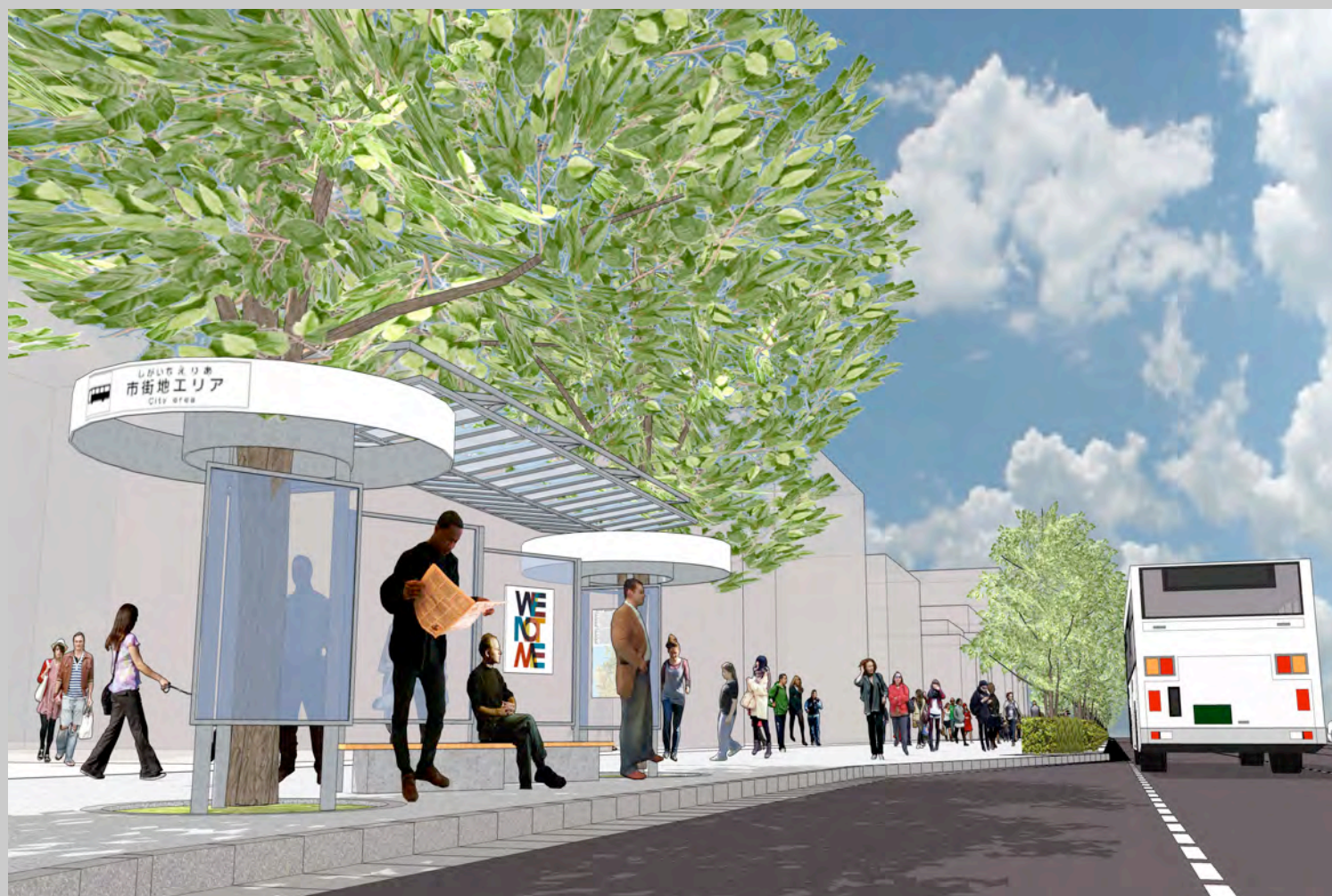
樹木による緑化は場所を問わず景観に調和する。緑のバス停は沖縄のどこの風景にも自然に溶け込む。ピクトサインの色彩によってエリア分けをおこなうが、形状は変えずに那覇のバス停全体の統一性をもたせる。